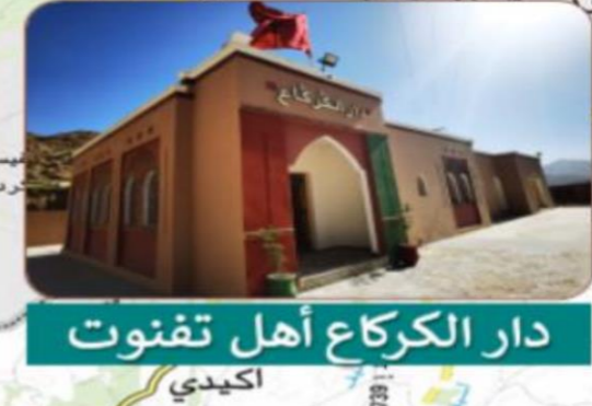
دار الكركاع أهل تفنوت