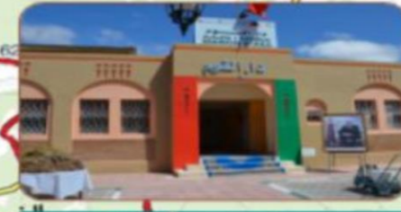
دار الثوم أساكي