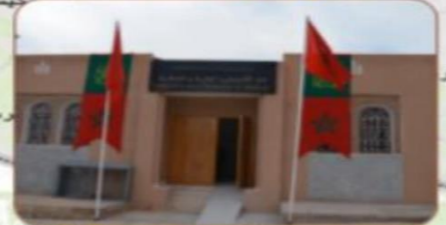
دار الأعشاب العطرية والطبية تالكجونت