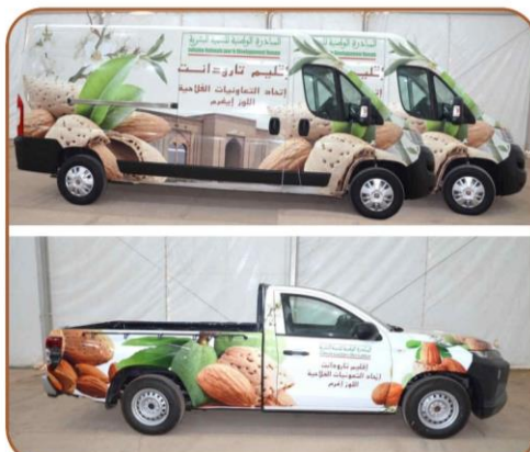
3 سيارات لنقل وتسويق منتجات دار اللوز