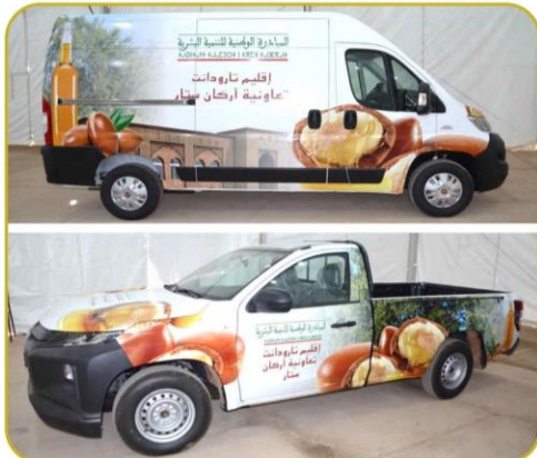
سيارتين لنقل وتسويق منتجات دار الأركان