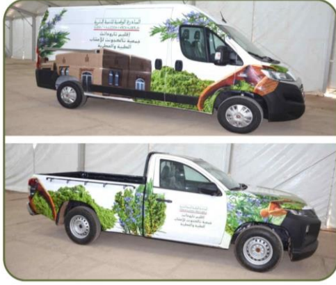
سيارتين لنقل وتسويق منتجات دار الأعشاب الطبية والعطرية