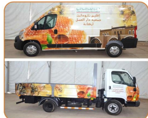
سيارتين لنقل وتسويق منتجات دار العسل