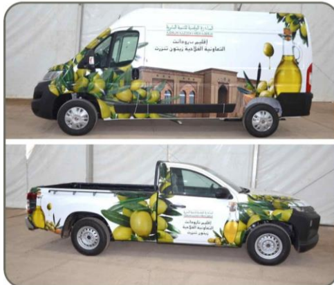
سيارتين لنقل وتسويق منتجات دار الزيتون