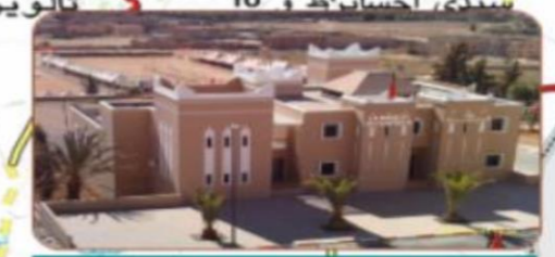
دار الزعفران تالوين