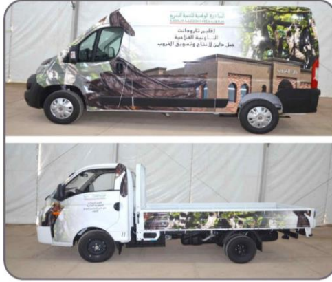
سيارتين لنقل وتسويق منتجات دار الخروب