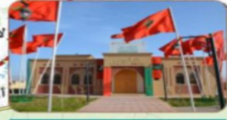
دار الزيتون تفتوت