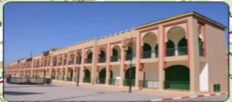
المعرض الدائم للمنتوجات المجالية بإقليم تارودانت والمركز الحرفي بتارودانت