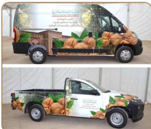
سيارتين لنقل وتسويق منتجات دار الكركاع