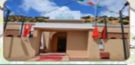
دار الخروب إيمولاس