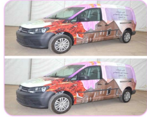
سيارتين لنقل وتسويق منتجات دار الزعفران