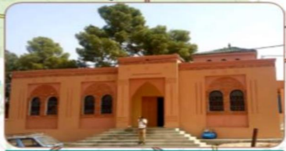
دار اللوز إغرم