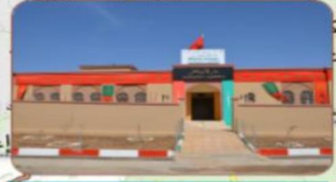
دار أركان تافنكولت