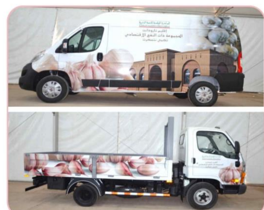
سيارتين لنقل وتسويق منتجات دار الثوم