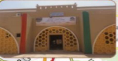
دار العسل أركانة