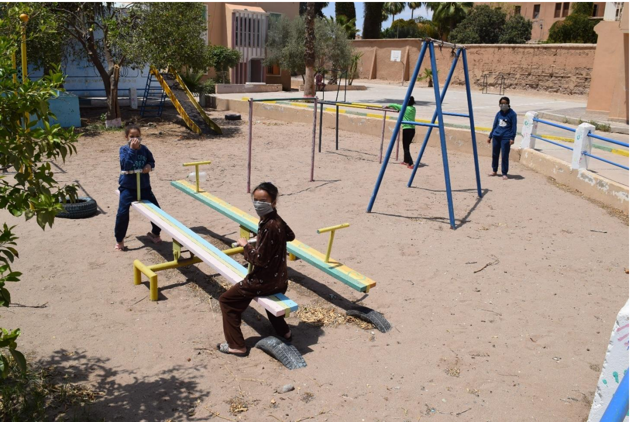
الأطفال المتخلي عنهم نزلاء العصبة المغربية لحماية الطفولة – فرع تارودانت –