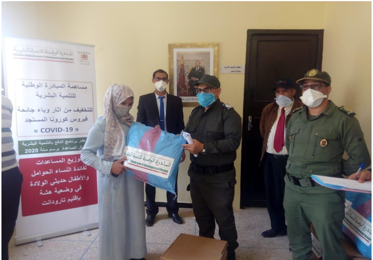
نموذج توزيع العدة الخاصة بالنساء الحوامل و النساء المرضعات بباثوية تارودانت