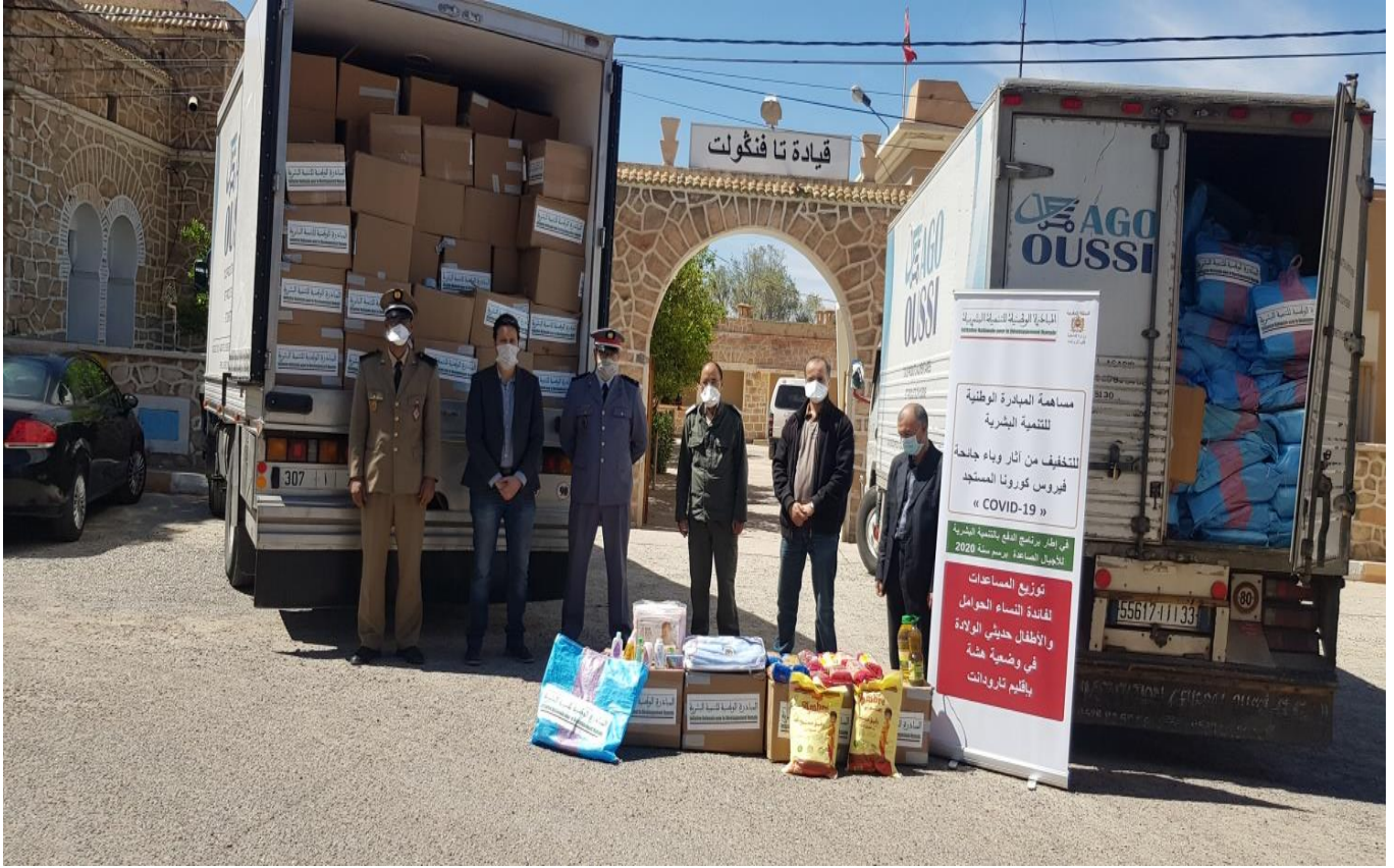
نموذج تسليم العدة الخاصة بالنساء الحوامل و النساء المرضعات بقيادة تافنكولت