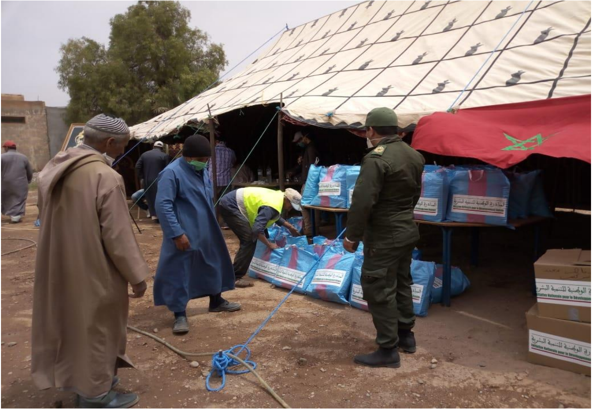
نموذج توزيع العدة الخاصة بالنساء الحوامل و النساء المرضعات بالدواوير بقيادة الفايز