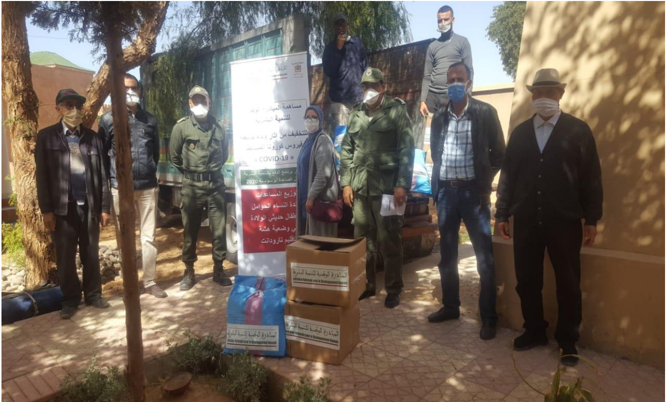
نموذج تسليم العدة الخاصة بالنساء الحوامل و النساء المرضعات بباشوية تارودانت