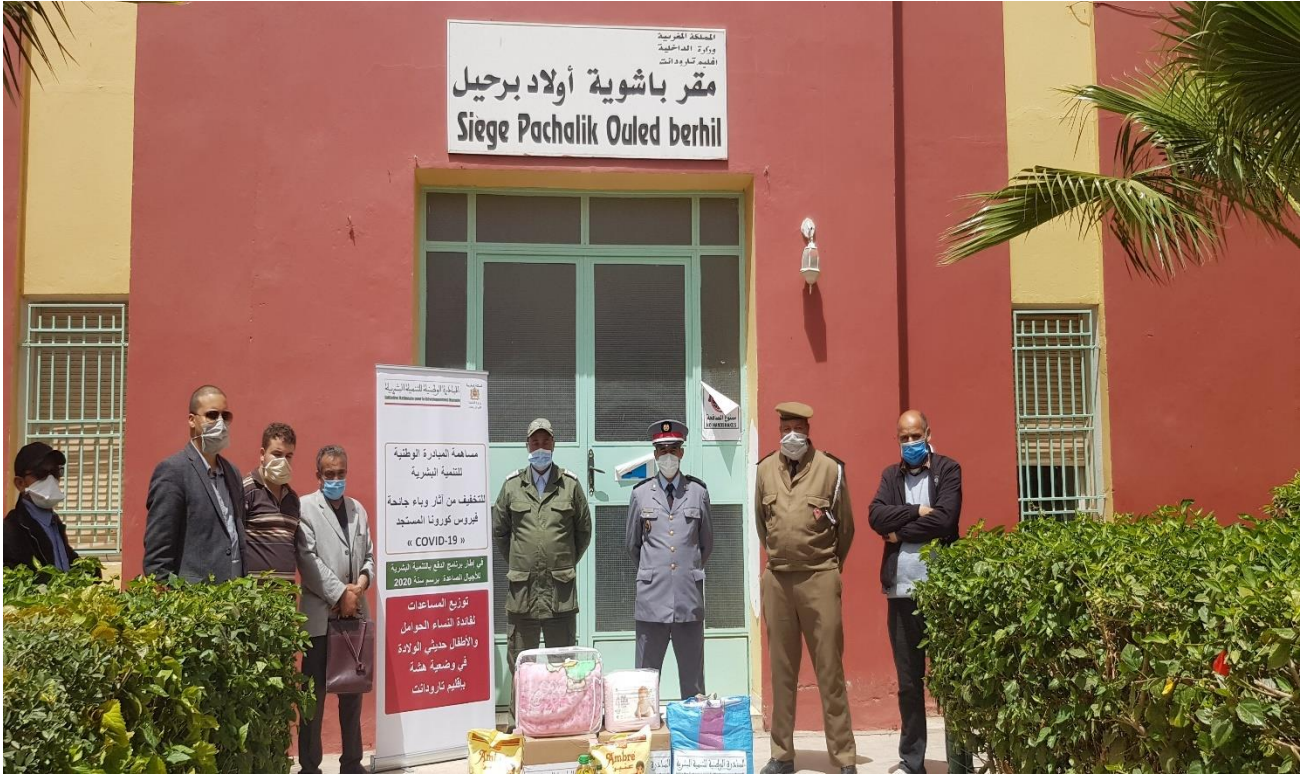
نموذج تسليم العدة الخاصة بالنساء الحوامل و النساء المرضعات بباشوية أولاد برحيل