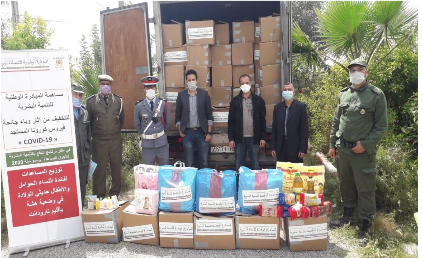
نموذج تسليم العدة الخاصة بالنساء الحوامل و النساء المرضعات بقيادة إكلي