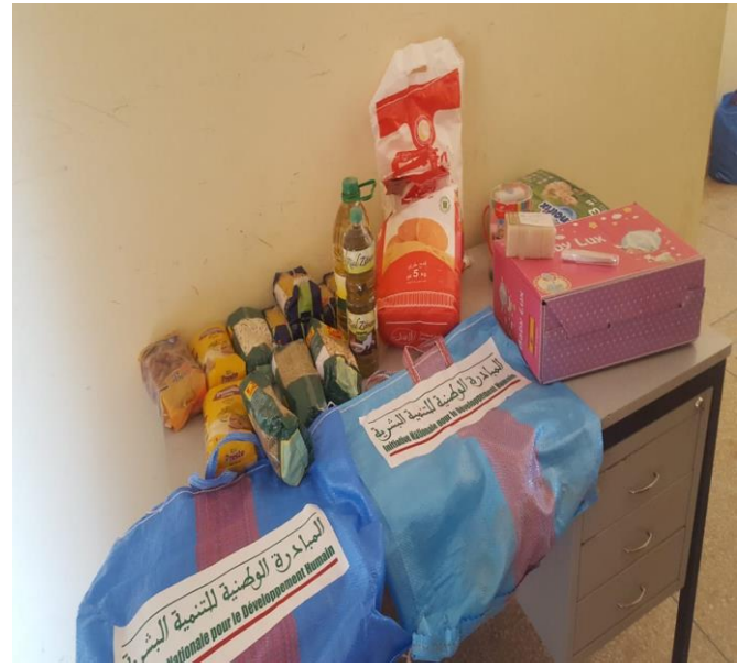
نموذج تسليم العدة الخاصة بالنساء الحوامل و النساء المرضعات بباشوية الكردان و قيادة أولاد محلة