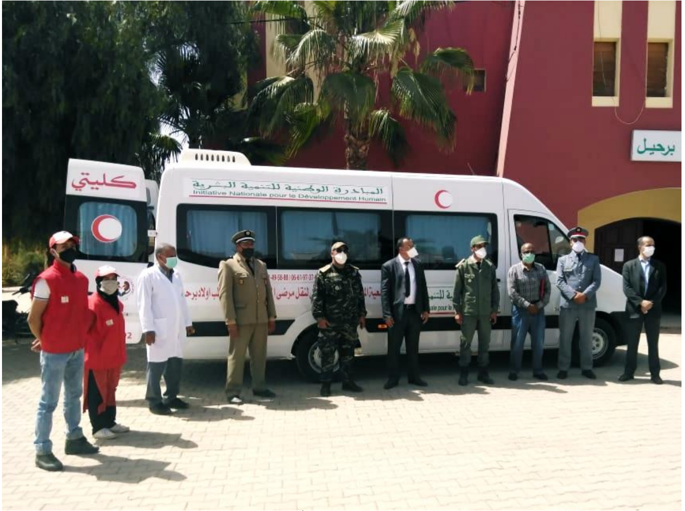
تسليم سيارة نقل مرضى القصور الكلوي بقطب أولاد برحيل لجمعية كليتي حياتي