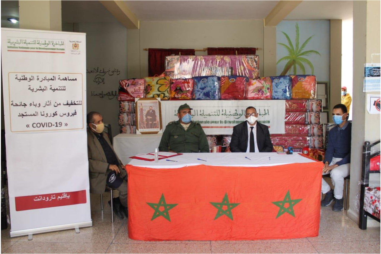
تسليم التجهيزات لفائدة المركب الاجتماعي بمدينة أيت إيعزة