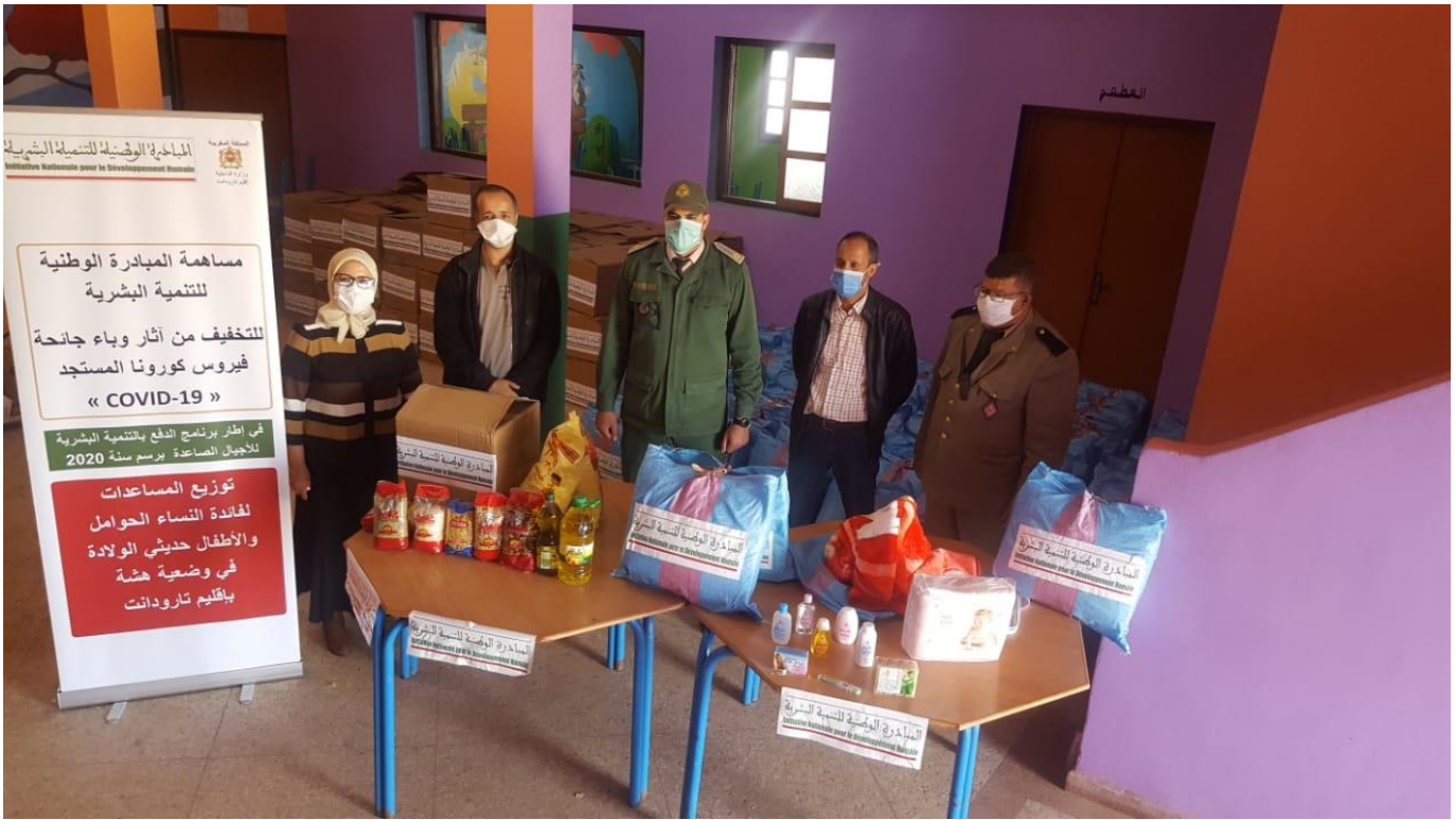
نموذج تسليم العدة الخاصة بالنساء الحوامل و النساء المرضعات بقيادة تازمورت