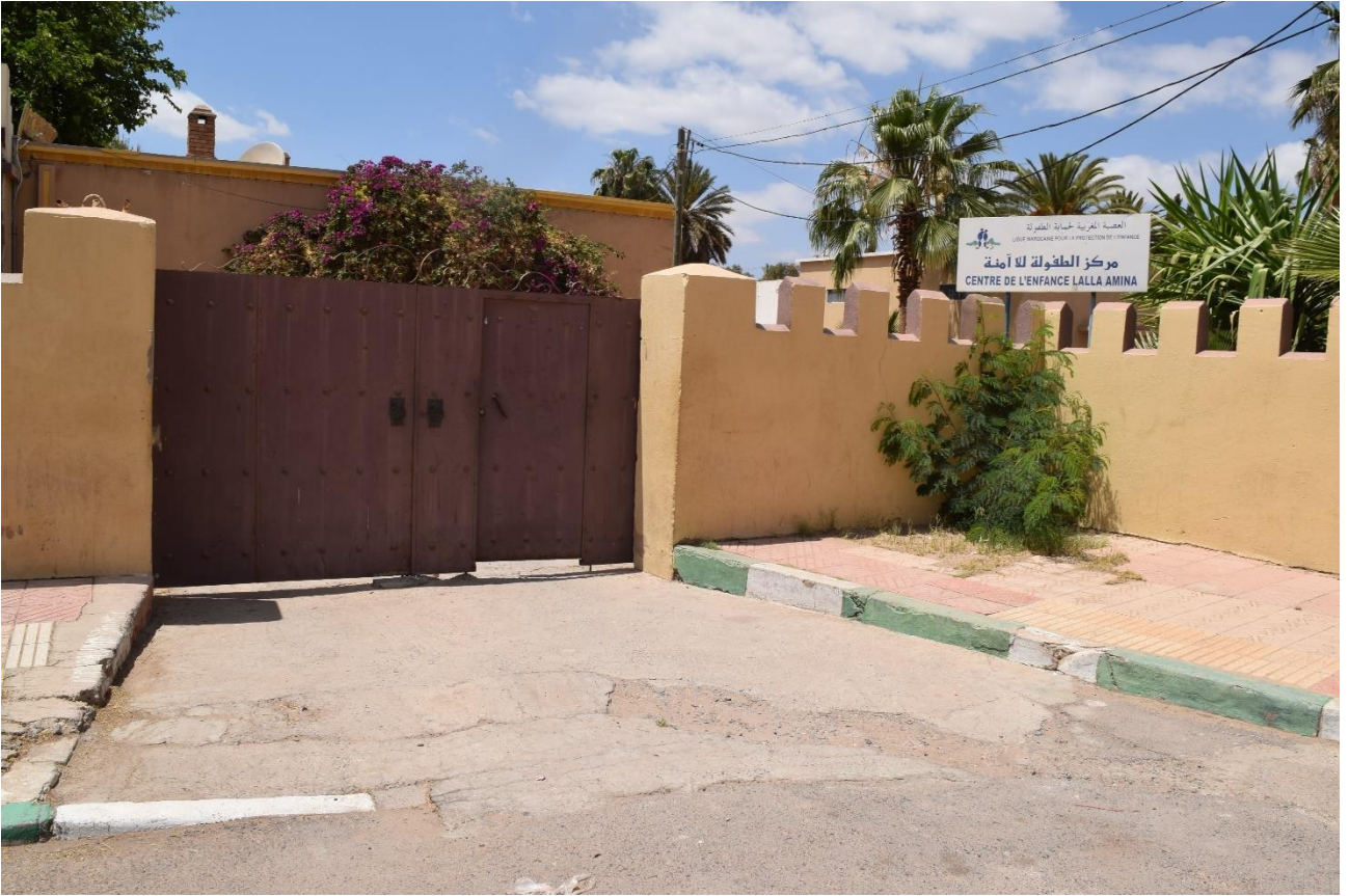
مقر العصبة المغربية لحماية الطفولة – فرع تارودانت