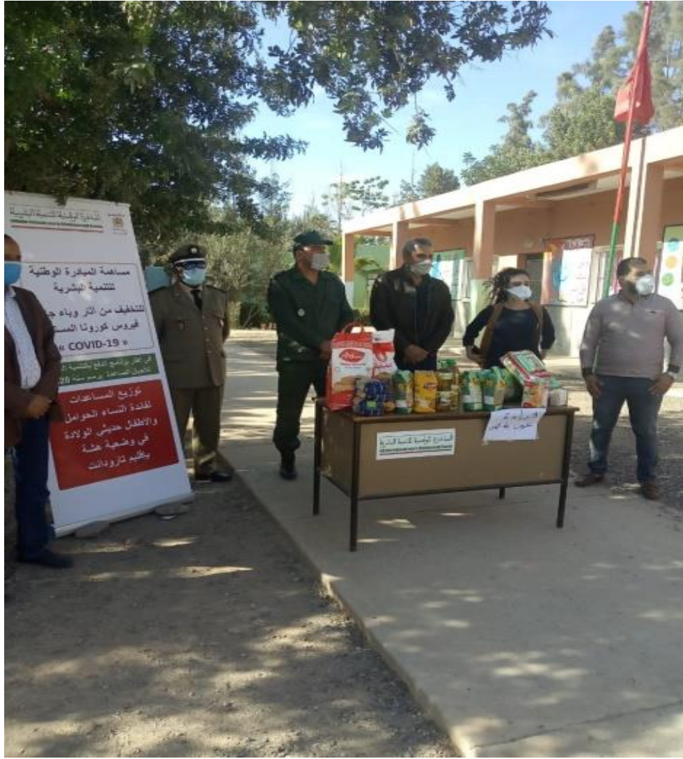
نموذج تسليم العدة الخاصة بالنساء الحوامل و النساء المرضعات بقيادة عين شعيب