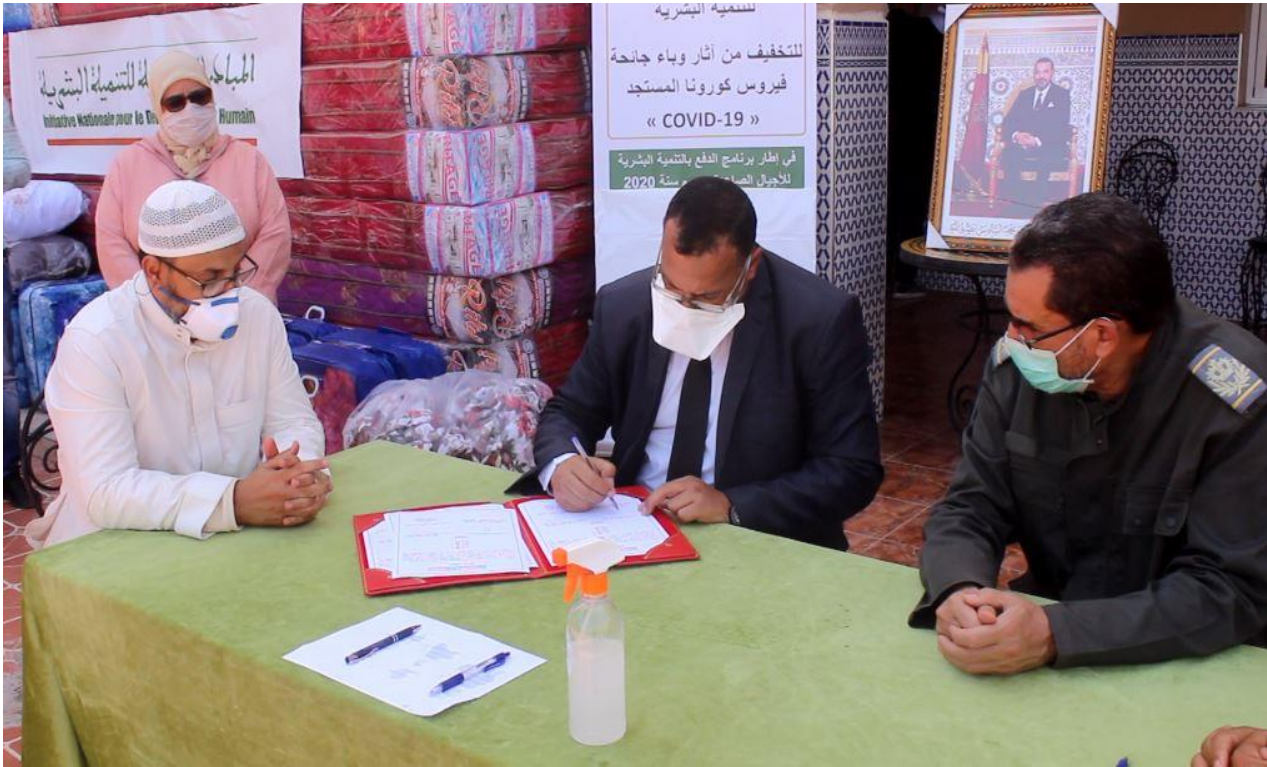
تسليم التجهيزات لفائدة المركب الاجتماعي الراءفة بمدينة أولاد تايمية