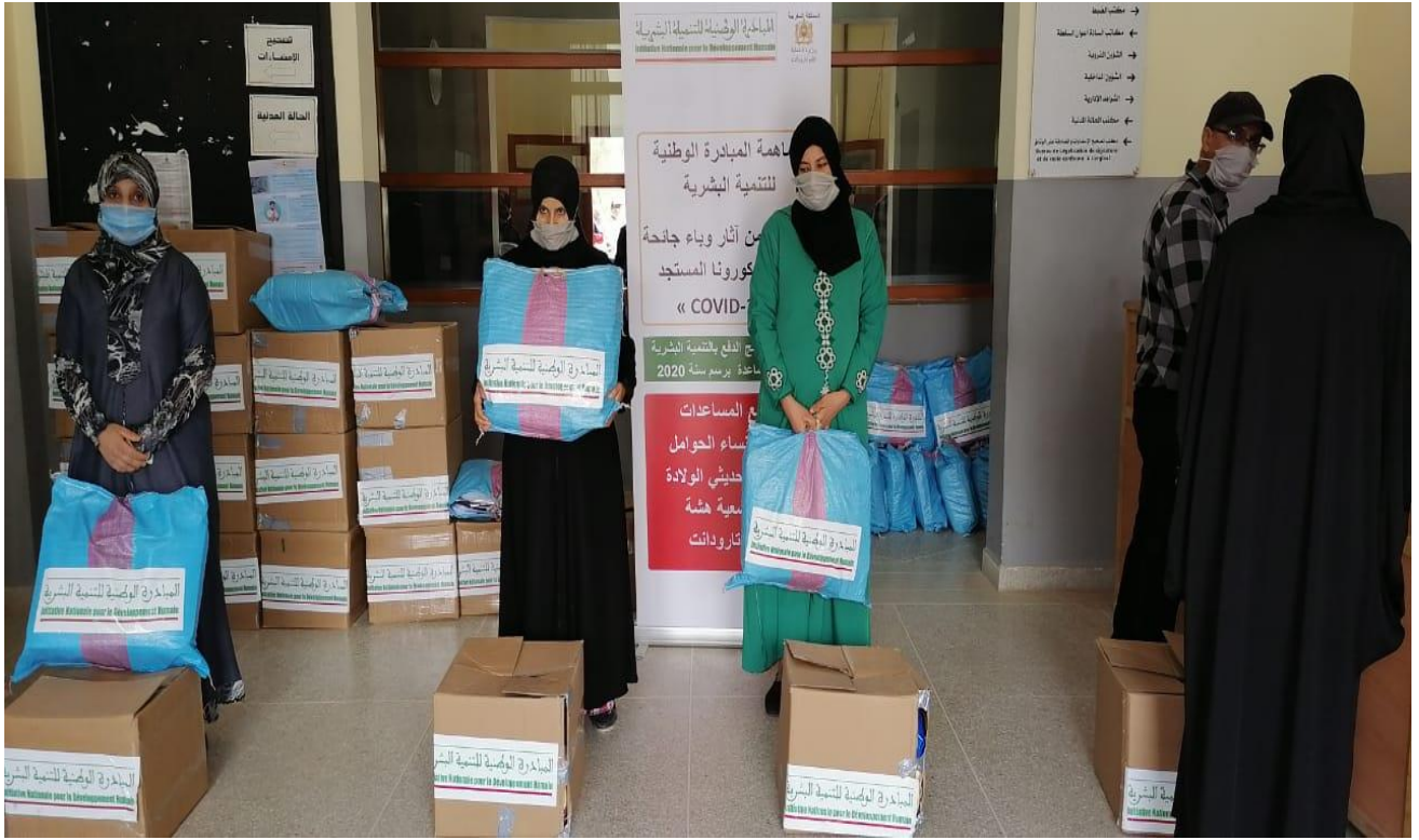
نموذج توزيع العدة الخاصة بالنساء الحوامل و النساء المرضعات بباثوية تارودانت