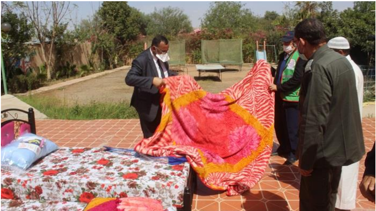
تسليم التجهيزات لفائدة المركب الاجتماعي الراءفة بمدينة أولاد تايمية