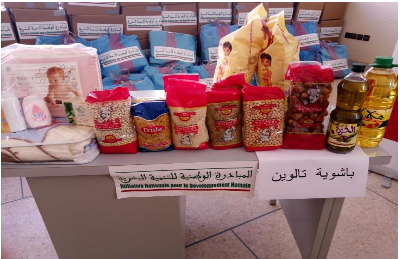
نموذج تسليم العدة الخاصة بالنساء الحوامل و النساء المرضعات بباشوية تالوين