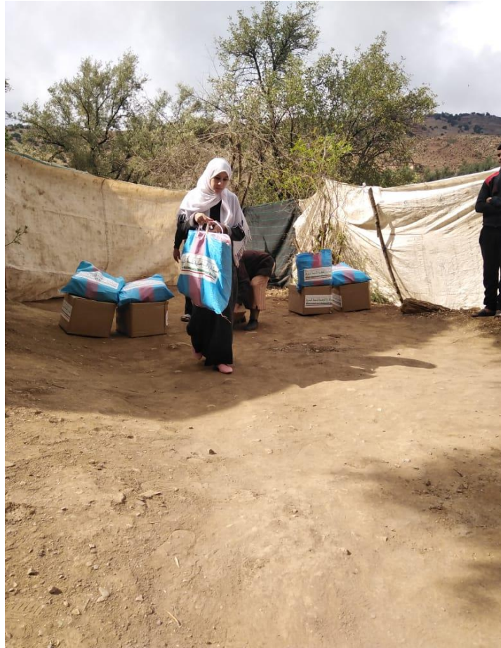
نموذج توزيع العدة الخاصة بالنساء الحوامل و النساء المرضعات بالدواوير بقيادة تافنكولت