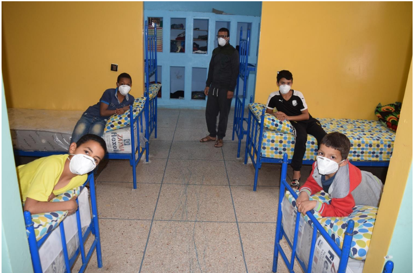
أطفال الشوارع نزلاء جمعية أهلي لحماية الطفولة