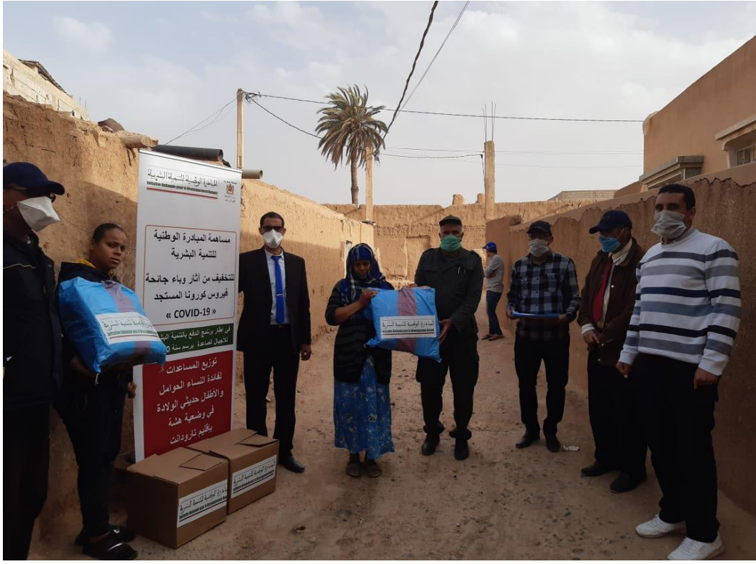
نموذج توزيع العدة الخاصة بالنساء الحوامل و النساء المرضعات بالأحياء الهامشية بمدينة تارودانت