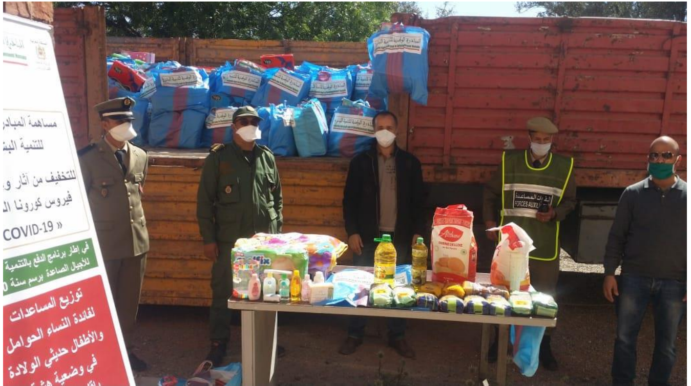
نموذج تسليم العدة الخاصة بالنساء الحوامل و النساء المرضعات بقيادة أركانة