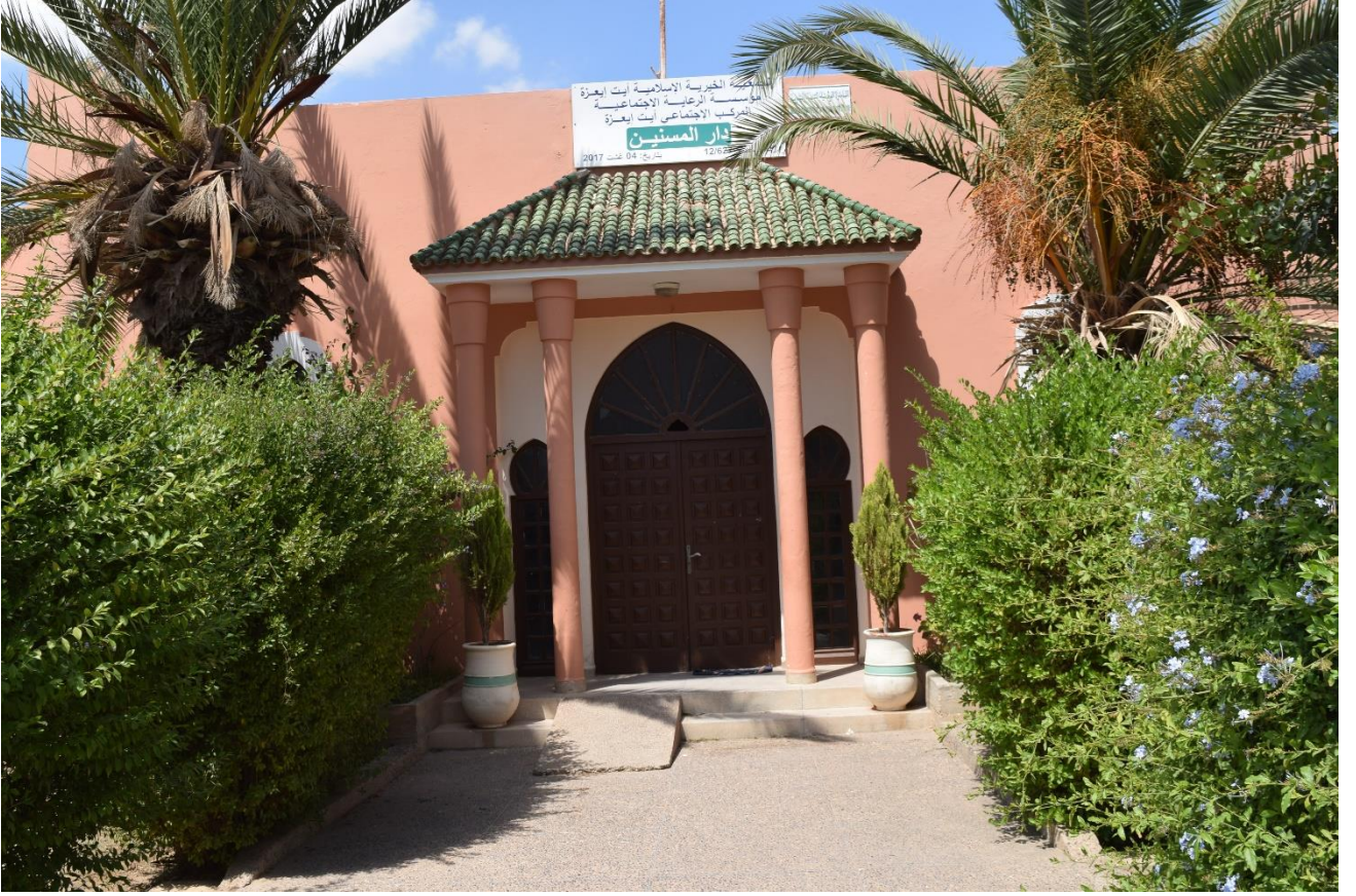
مخر الجمعية الخيرية الإسلامية أيت إيعزة