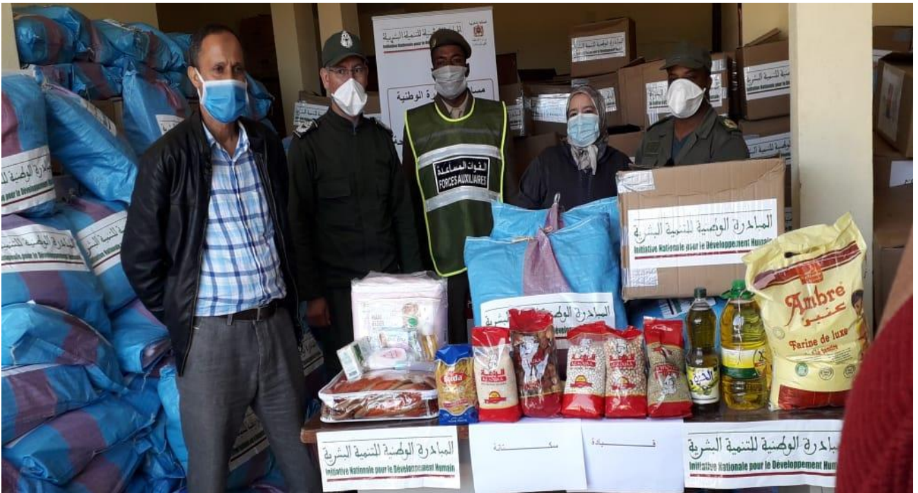
نموذج تسليم العدة الخاصة بالنساء الحوامل و النساء المرضعات بقيادة سكتانة