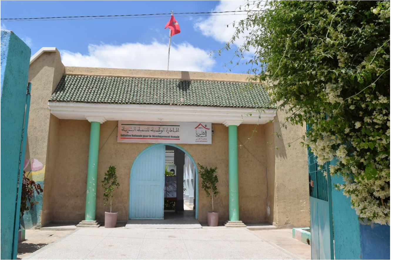
مقر جمعية أهلي لحماية الأطفال في وضعية صعبة