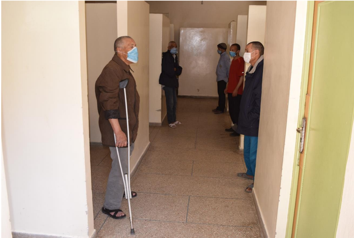
النزلاء المسنين بالمركز الاجتماعي التربوي دار الخير بمدينة تارودانت