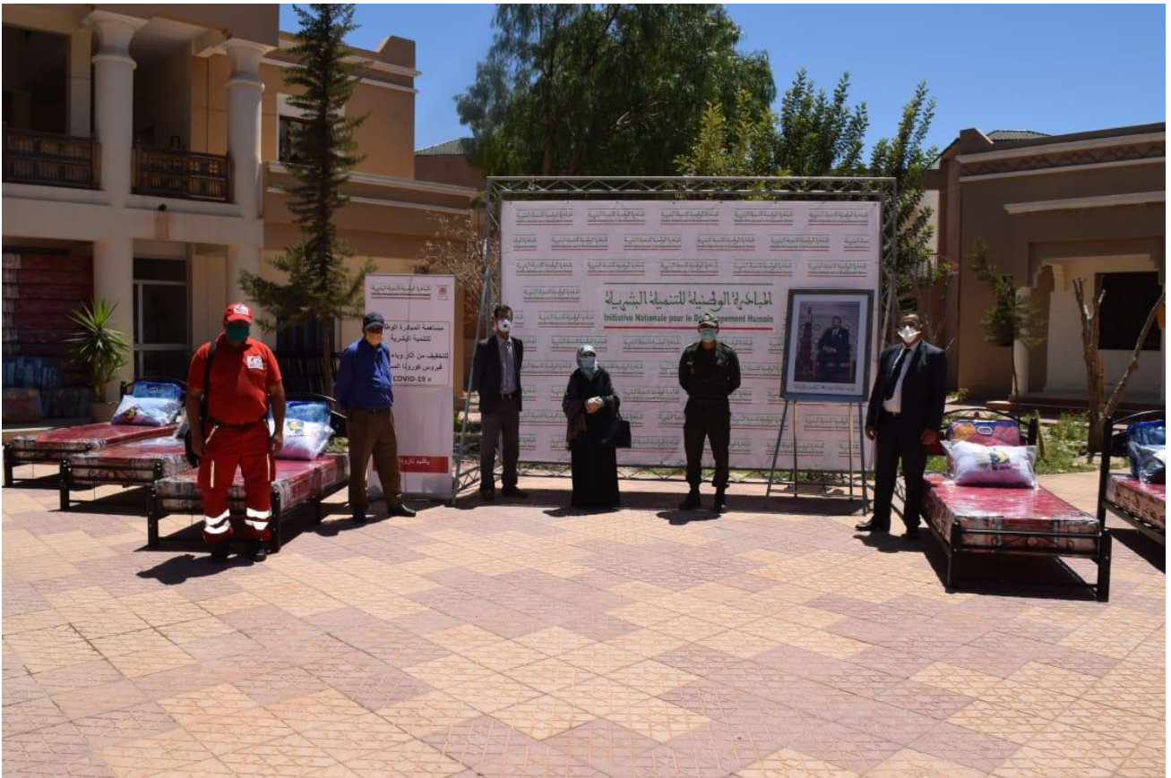
تسليم التجهيزات لفائدة الجمعيات المستفيدة بمدينة تارودانت