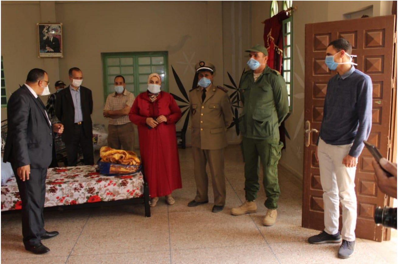
تسليم التجهيزات لفائدة المركب الاجتماعي بمدينة أيت إيعزة