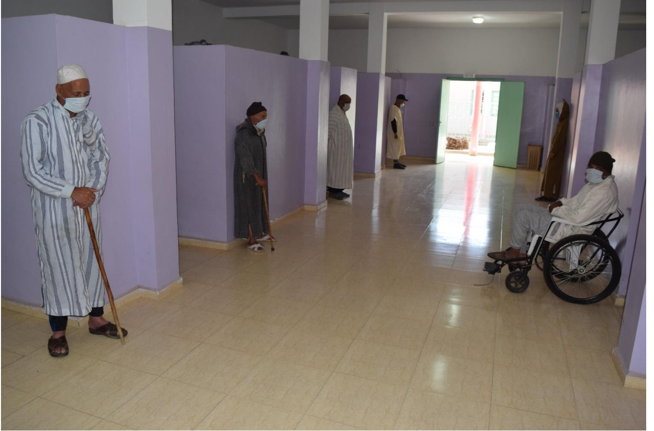
النزلاء المسنين بالمركب الاجتماعي أيت إيعزة