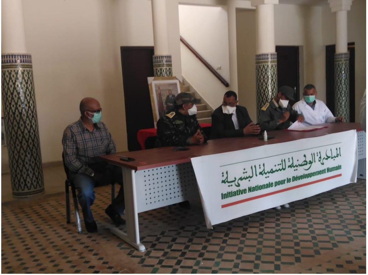
تسليم سيارة نقل مرضى القصور الكلوي بقطب أولاد برحيل لجمعية كليتي حياتي