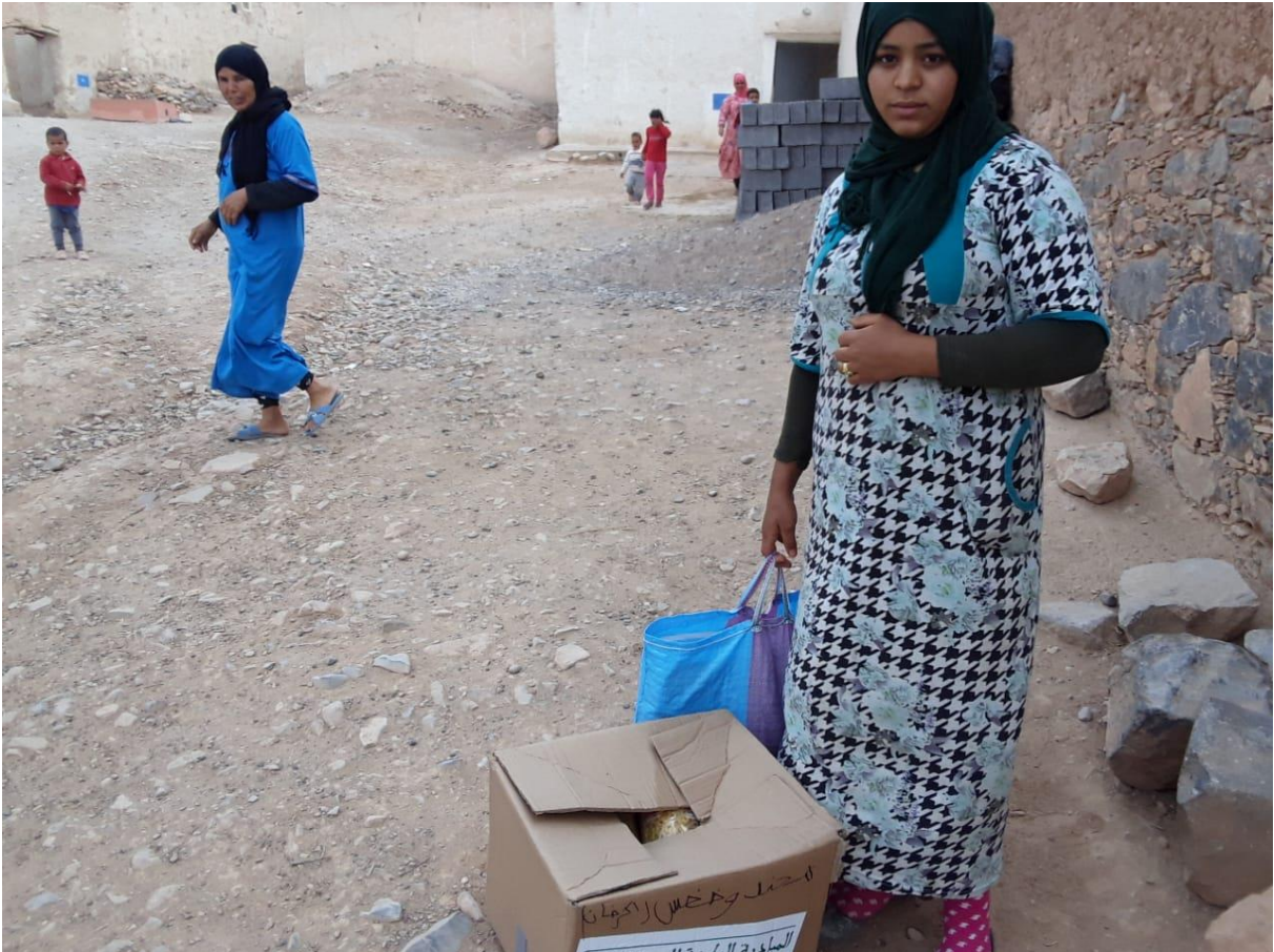
نموذج توزيع العدة الخاصة بالنساء الحوامل و النساء المرضعات بالدواوير بقيادة الفايز