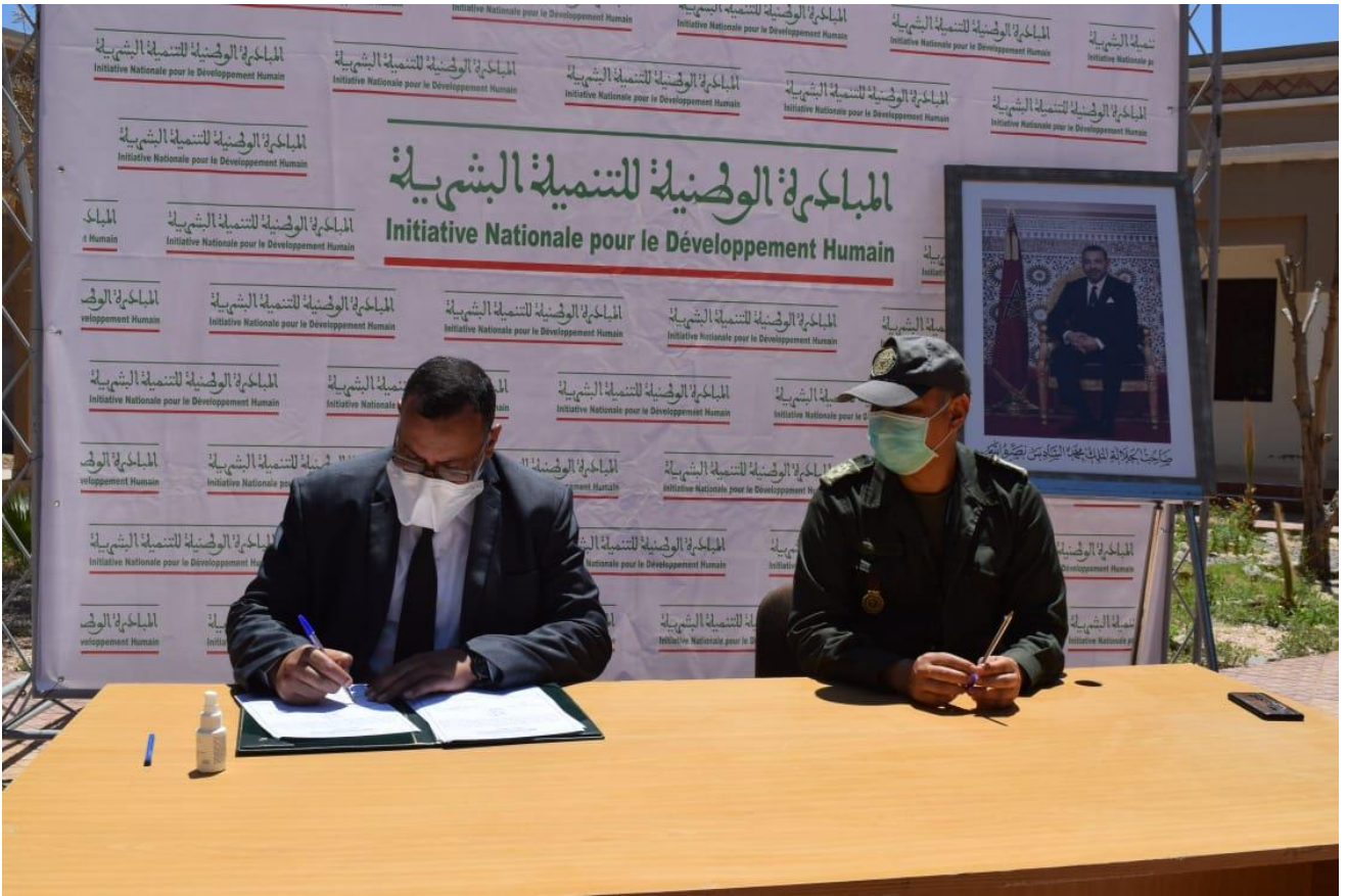
تسليم التجهيزات لفائدة الجمعيات المستفيدة بمدينة تارودانت