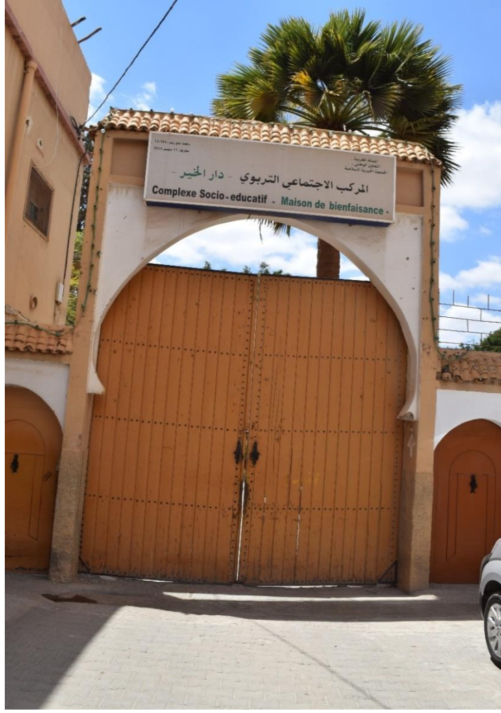
مقر الجمعية الخيرية الإسلامية تارودانت