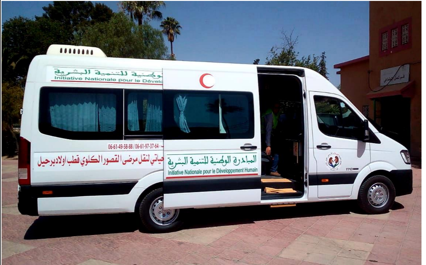
سيارة نقل مرضى القصور الكلوي بقطب أولاد برحيل