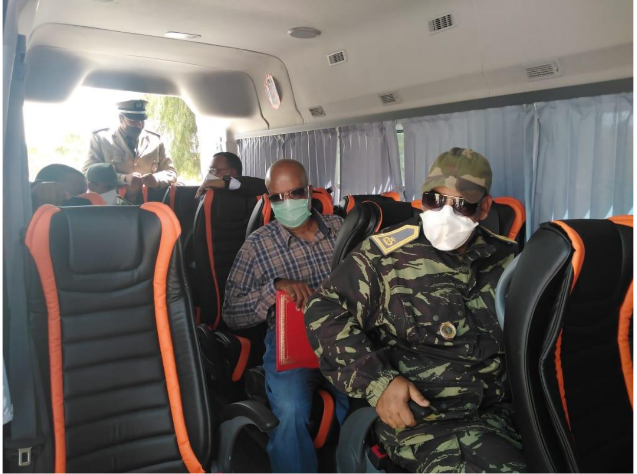
تسليم سيارة نقل مرضى القصور الكلوي بقطب أولاد برحيل لجمعية كليتي حياتي