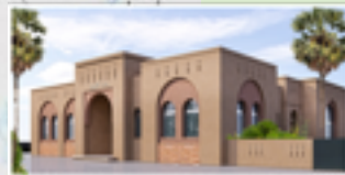
دار الثوم بأساكي