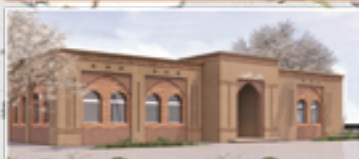
دار اللوز بجماعة إغرم