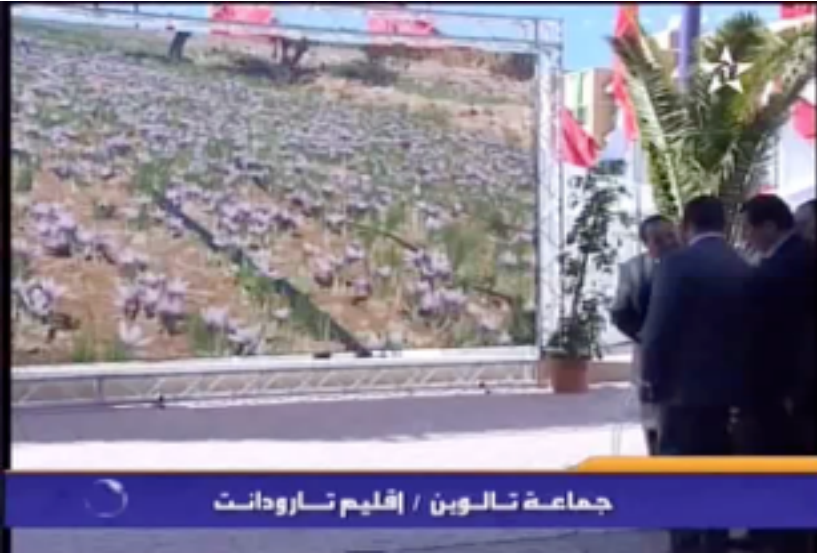
جماعة تالوين / إقليم تارودانت

انسجاما مع مبادئ المبادرة الوطنية للتنمية البشرية في دعم الأنشطة المدرة للدخل قصد الرفع من المستوى المعيشي للسكان وتأهيل الاقتصاد التضامني و الاجتماعي وتلبية كذلك للحاجيات الملحة للسكان بمختلف الجماعات الترابية بإقليم تارودانت لخلق فرص الشغل من خلال تثمين المنتوجات الفلاحية والغابوية المحلية التي يزخر بها الإقليم ، وعلى غرار النتائج الإيجابية لكل من دار الزعفران بتالوين التي سبق لصاحب الجلالة الملك محمد السادس نصره الله وأيده أن دشنها سنة 2011. و كذلك دار العسل بأركانة ، قررت اللجنة الإقليمية للتنمية البشرية المصادقة على مشاريع بناء و تجهيز 9 دور لتثمين المنتوجات المحلية (دار اللوز بجماعة إغرم – دار الزيتون بجماعة تنزرت – دار الكركاع بجماعة أهل تفتوت – دار الخروب بجماعة إيمولاس – دار الأعشاب العطرية و الطبية بجماعة تالكجونت – دار الأركان بجماعة تافنكولت – دار الثوم بجماعة أساكي – دار الصبار بجماعة إملمايس – دار الحناء بجماعة المنيزلة).