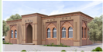
دار الحصل بأركانة