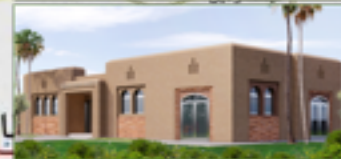
دار الأعشاب الطبية و العطرية بتالكجولت