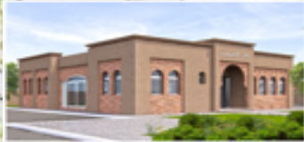
دار الخروب بإيمولاس