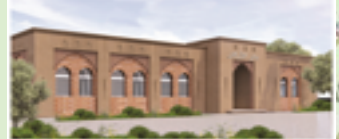
دار الحناء بالمتيزلة