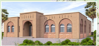
دار الحناء بالمتيزلة