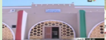
دار أركان بتافنكولت