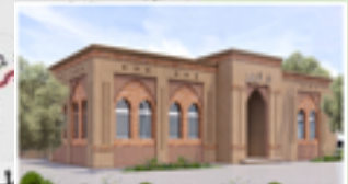
دار الزيتون بتنزرت