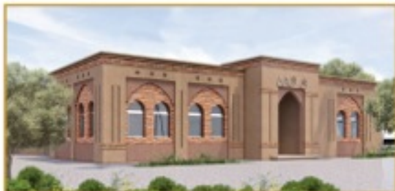
منظور الواجهة الرئيسية