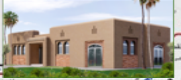
دار الأعشاب الطبية و العطرية بتالكجولت