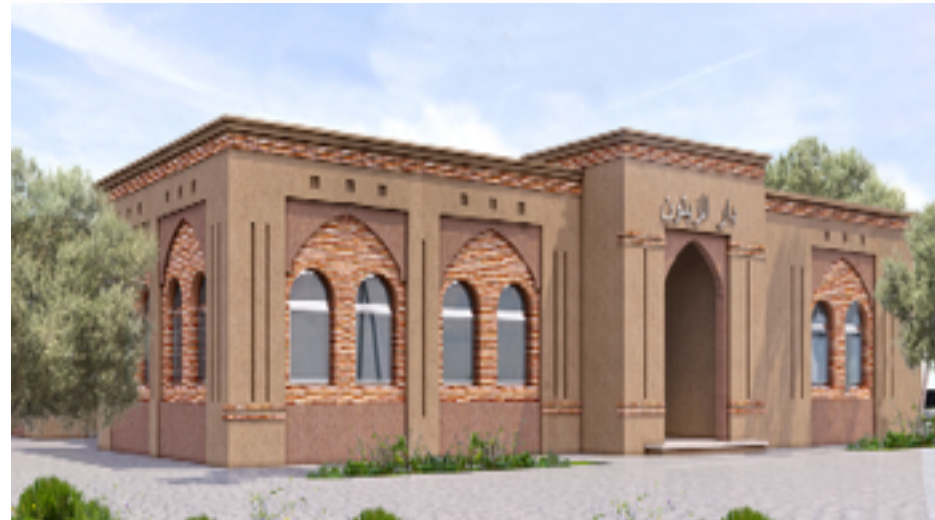
منظر الواجهة الرئيسية