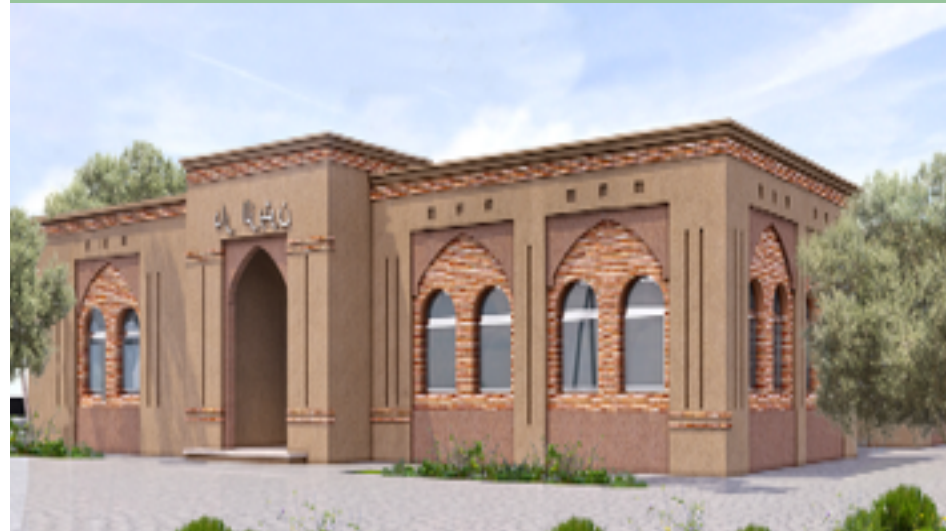
منظور الواجهة الرئيسية