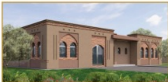
منظور الواجهة الجانبية