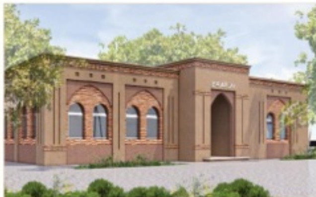
منظور الواجهة الرئيسية للمشروع