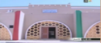
دار أركان بتافنكولت