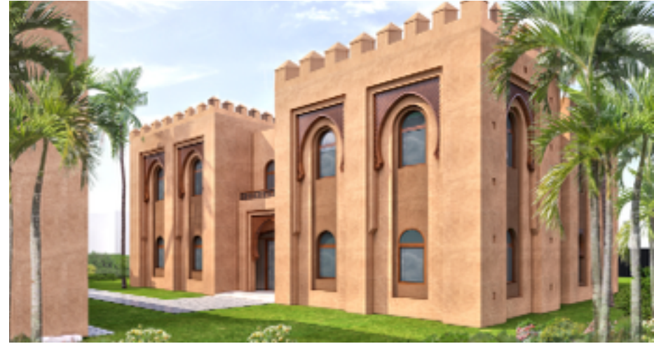
ورشات التكوين الحرفي