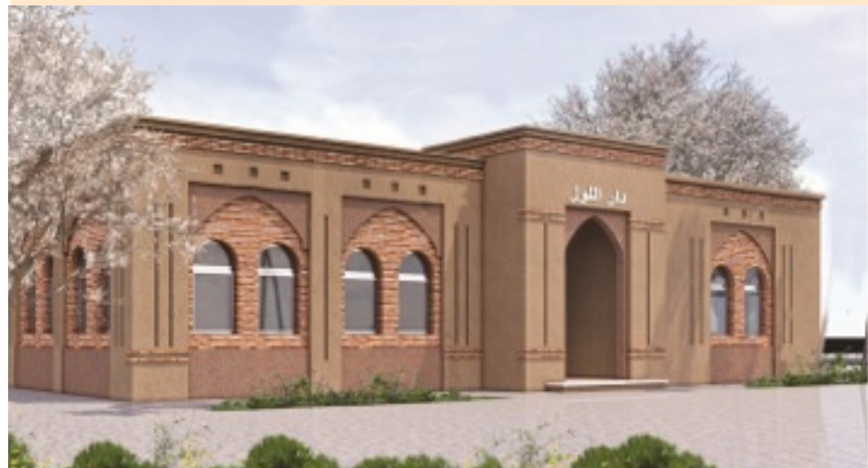
منظر الواجهة الرئيسية