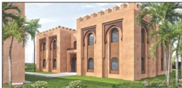
منظور بناية ورشات التكوين الحرفي