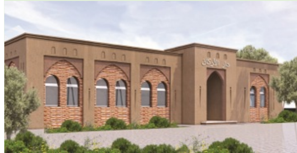
منظر الواجهة الرئيسية