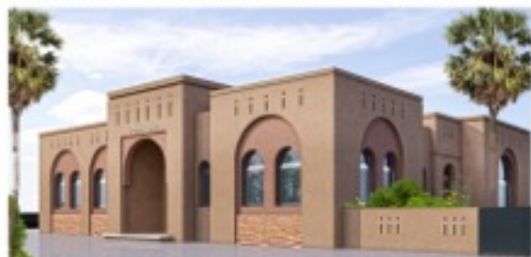
منظوري الواجهة الرئيسية