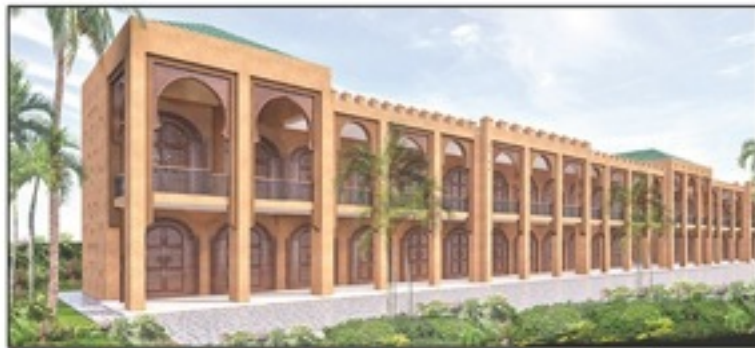
منظور المركز المندمج لتسويق و تّثمين المنتوجات المحلية