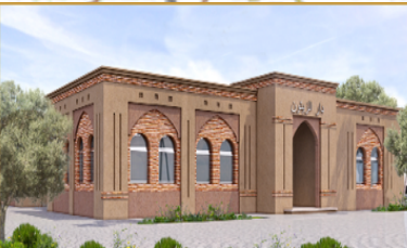
دار الاعشاب الطبية و العطرية بتالنجوت