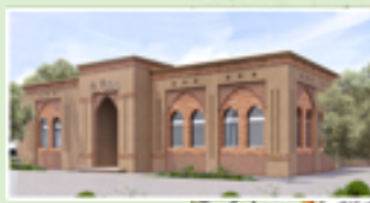
دار الحصل بأركانة