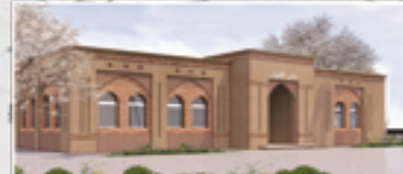
دار اللوز بجماعة إغرم