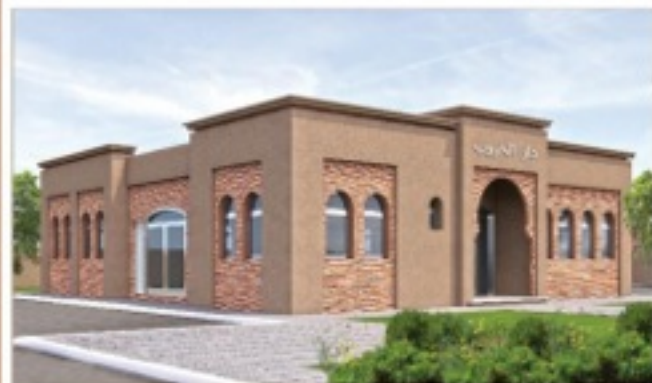
منظور الواجهة الرئيسية للمشروع