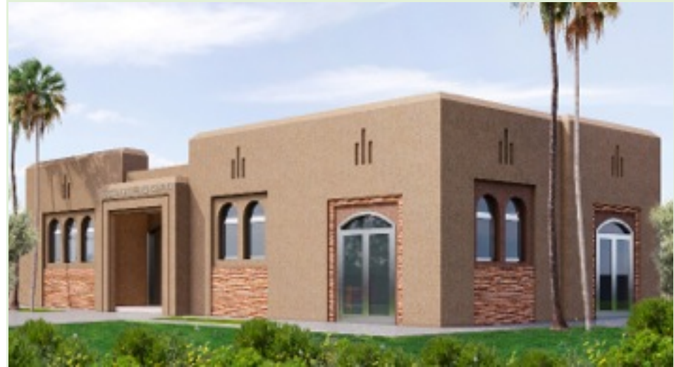
منظر الواجهة الرئيسية