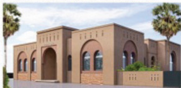
منظوري الواجهة الرئيسية