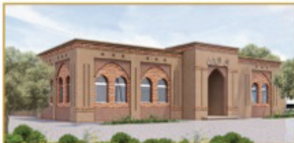
منظور الواجهة الرئيسية