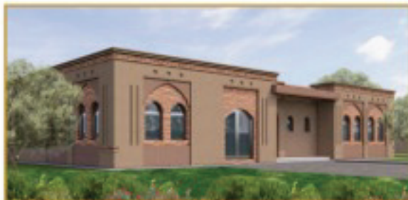
منظور الواجهة الجانبية