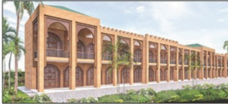
منظور المركز المندمج لتسويق و تثمين المنتوجات المحلية