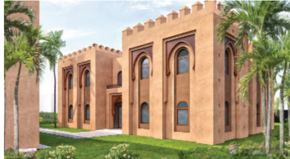
ورشات التكوين الحرفي