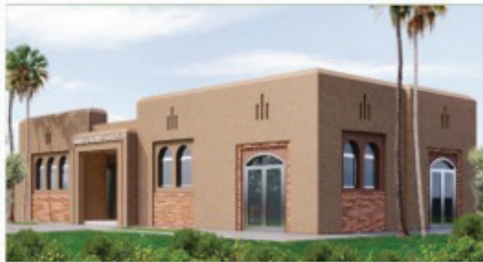
منظور الواجهة الرئيسية للمشروع