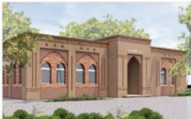
منظور الواجهة الرئيسية للمشروع