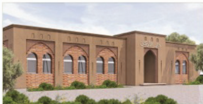
منظور الواجهة الرئيسية للمشروع