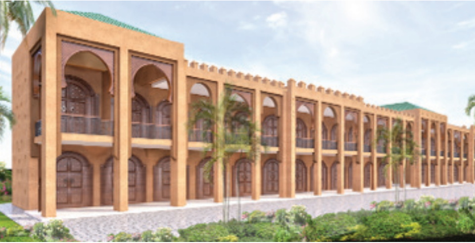
المعرض الدائم لتسويق وتثمين المنتجات المحلية