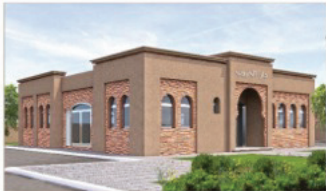
منظور الواجهة الرئيسية للمشروع