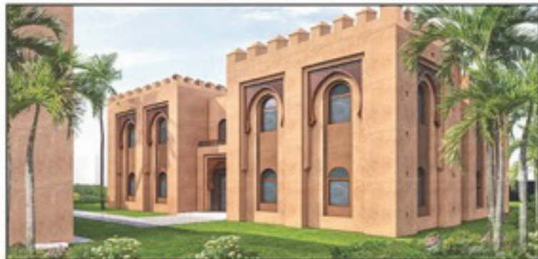
منظور بناية ورشات التكوين الحرفي